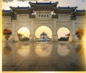
อนุสรณ์เจียงโคเซค