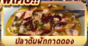
ปลาต้มผักกาดดอง