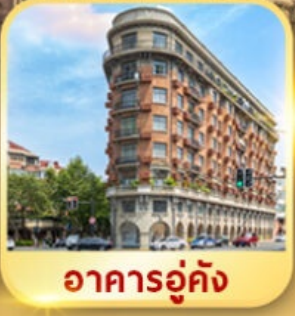
อาคารอู่คัง