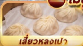
Siêu hòng péa