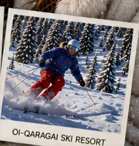
OI-QARAGAI SKI RESORT