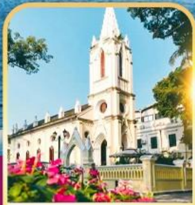
เกาซาเมี่ยน