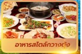
อาหารสตรีทกวางตุ้ง