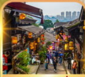
หมู่บ้านโบราณฉือชี่เซว