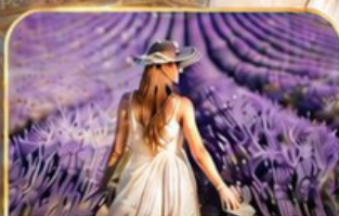
ทุ่งดอกลาเวนเดอร์