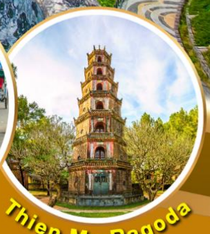
Thien Mu Pagoda