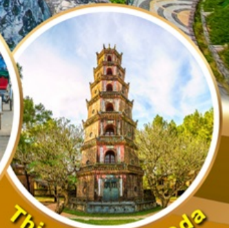
Thien Mu Pagoda