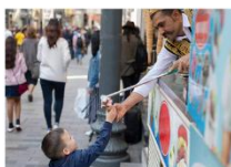
ไอศกรีม Maraş ชมพระอาทิตย์ตกดิน ณ ภูเขาเนมรุต