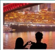
ถนนจินซาเหมิน