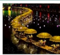
คลองเรือมังกรแม่น้ำก้งซู่