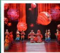
โชว์ซีหลานซาตู้