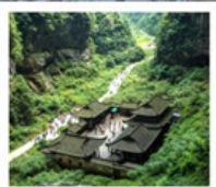
หลุมพีาสะพานสวรรค์