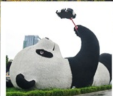
รูปปั้นแพนด้าเซิลฟี