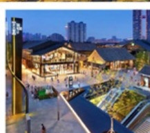
ถนนคนเดินไท่กู่หลี่