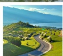
กุขาอวั้นเซียงซาน