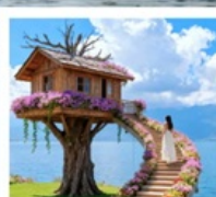
หมู่บ้านเหวินปี้

เมืองโบราณต้าหลี่ / นั่งเรือสู่เกาะเสี่ยวผู่ / ซานโตรินี่ (รวมรถแท็กซี่) / ถนนชางเอ๋อต้าต้า / กุขาอวั้นเซียงซาน / ต้าช่าก่าเรือหลงกัน โค้ง S ทะเลสาบเอ้อไห่ / หมู่บ้านโบราณสี่โจว / หมู่บ้านเหวินปี้ / ชมดอกไม้ตามฤดูกาล