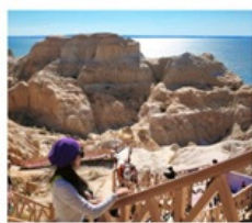
เขตปีศาจทะเล