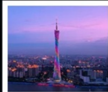
แคนตันทาวเวอร์