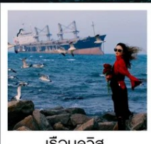
เรือบลูวิส

หอคอยกาลเวลา / รูปปั้นปลาวาฬ / ถนนโบราณเตาหยาง / ย่านสงโขว่ 1920 / เมืองเว่ยไห่ / ถนนฮิวจวีป่า / จตุรัสประตูแห่งความสุข ย่านอันเลอฟาง / เรือบลูวิส / หาดซาจื่อฮั่ว / ถนนหลงเจียง / สะพานจันเตียว / หาดไซเบอร์ No. 3 ถนนจงซาน / โบสถ์ St.Emill / จตุรัส 54 / ศูนย์เรือใบโอลิมปิก / พิพิธภัณฑ์เบียร์ชิงเต่า / ถนนไถ่ตง / ท่าเรือประมงเหยียนโกะ