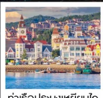
ท่าเรือประมงเหยียนโกะ