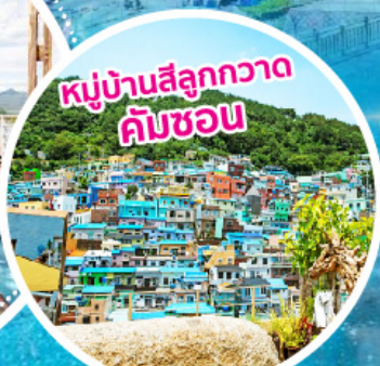
หมู่บ้านสีลูกกวาด คิมซอน

• ตลาดปลาจากัลลี • ท่าเรือชางนึม • คาเฟ่ริมทะเล RAFIK • กำแพงไวน์สุดอินเทรนด์ • อาสนวิหารคาทอลิกชุกซอง