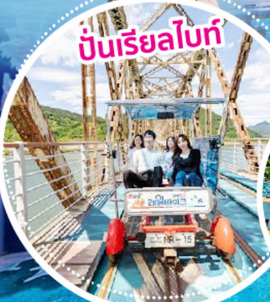
ปั่นเรียวไลท์