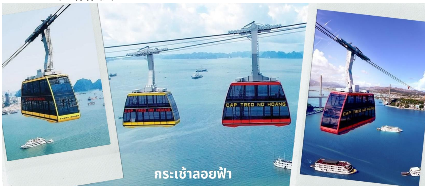
กระเช้าลอยฟ้า

เที่ยง รับประทานอาหารกลางวัน ณ บนเรือที่ล่อง (8) (เมนูซีฟู้ดสไตล์เวียดนาม) จากนั้นนำท่านนั่ง Queen Cable Car กระเช้าลอยฟ้า 2 ชั้นที่ใหญ่ที่สุดในโลก จุคนได้มากถึง 250 คนต่อเที่ยว สามารถรับ-ส่งผู้โดยสารได้มากถึง 2,000 คนต่อชั่วโมง กระเช้าลอยฟ้า 2 ชั้นยิ่งใหญ่อลังการนี้เป็นส่วนหนึ่งของสวนสนุก Sun World Halong Park สร้างโดย Doppelmayr/Garaventa Group จากประเทศสวิตเซอร์แลนด์และออสเตรเลีย โดยมีความพิเศษที่สามารถทำลายสถิติโลก และได้รับการบันทึกลงใน Guinness World Records ถึง 2 รายการ คือ เป็นกระเช้าที่จุคนได้มากที่สุดในโลก และมีเสาคอนกรีตส่งกระเช้าที่สูงที่สุดในโลก ด้วยความสูงถึง 188.88 เมตร