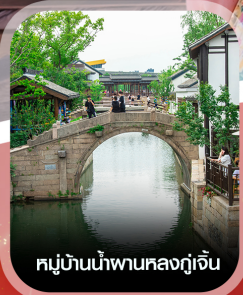
หมู่บ้านน้ำผานหลงกู่เจิน