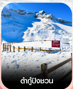
ต่ำกู่ปิงชวน