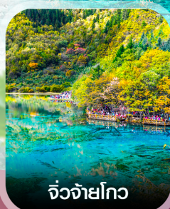
จื่อจ้ายโกว