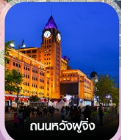
ถนนหลวงฟู้จิ่ง

คอนเฟิร์มออกเดินทาง ทุกพีเรียด 2 ท่านขึ้นไป