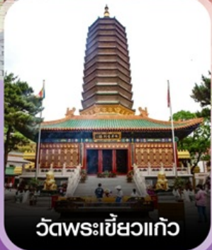
วัดพระเขี้ยวแก้ว