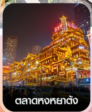
ตลาดหงหย่าต้ง