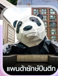
แพนด้ายักษ์ป็นตึก