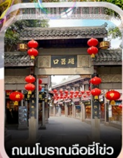
ถนนโบราณฉือซีโซ่ว