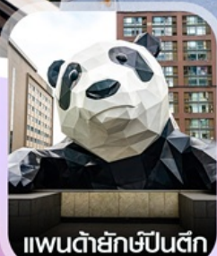
แพนด้ายักษ์ป็นตึก

✈️ คอนเฟิร์มออกเดินทาง ทุกพีเรียด 2 ท่านขึ้นไป