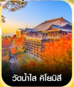
วัดน้ำใส คิโอมิชิ

คอนเฟิร์มออกเดินทาง ทุกพีเรียด 2 ท่านขึ้นไป