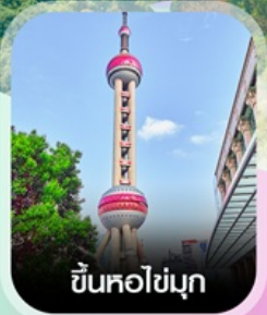
ขึ้นหอไข่มุก