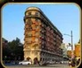
ถ่ายรูปจุดเช็คอิน WUKANG MANSION