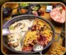
พิกัด เมนูห้องไฟ ลู่ที้ หม้อไฟสไตล์จีน