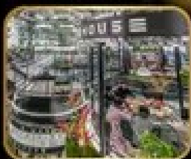
ภัตตาคาร ดีเด่น WAREHOUSE NO.3