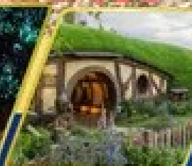
หมู่บ้านฮ็อบบิต