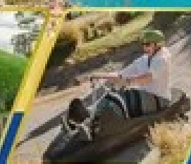
เล่นสูง ที่ควีนส์ทาวน์

✚ บินภายใน ( เกือบสุดคุ้ม ) พักโรงแรม 4 ดาว ★★★★★