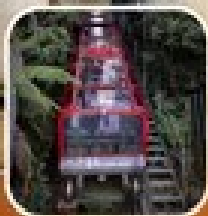
ดูทิวทัศน์เมืองเมลเบิร์น