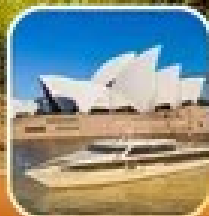
ท่องเที่ยวชมอ่าวซิดนีย์