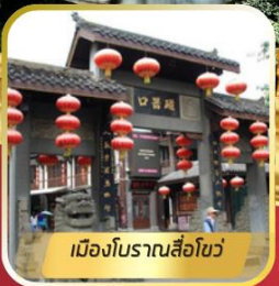
เมืองโบราณลั่วโข่ว