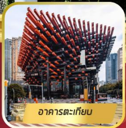
อาคารตะเกียบ