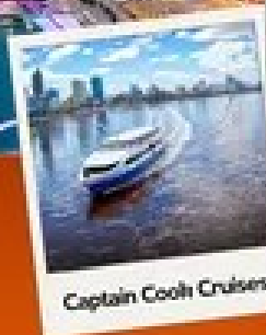
Captain Cook Cruises