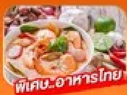
พิเศษ..อาหารไทย

1 - 5 เม.ย. / 29 เม.ย. - 3 พ.ค. 69 27 - 31 พ.ค. 69