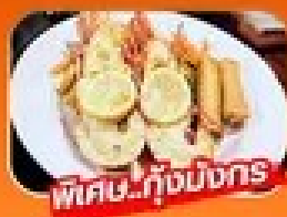
พิเศษ..ก๊อ่มังกร