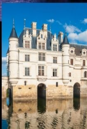
ปราสาทลุ่มแม่น้ำลัวร์