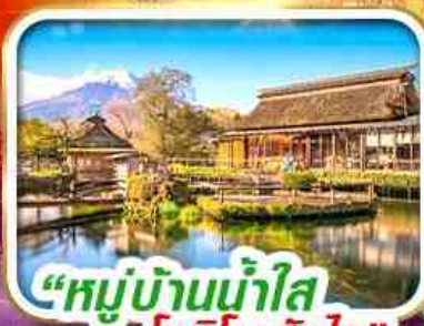
“หมู่บ้านน้ำใส โอชิโนะฮักไก”