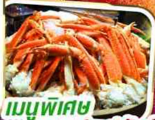
เมนูพิเศษ บุฟเฟ่ต์ขาปูยักษ์

ราคาเพียง 35,999 *รวมภาษีและค่าธรรมเนียม*