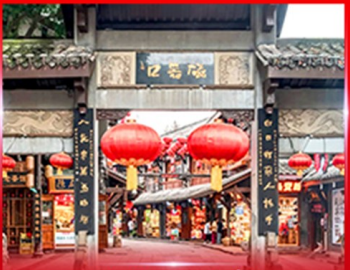
หมู่บ้านโบราณฉิวฉิว