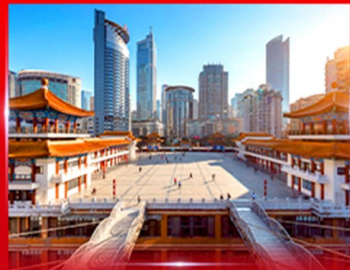
เซ็กอิน ตึกโควซิงโหล

OPTION ซีตี้ทัวร์ธงจีน ชมเขื่อนต้า, POPMART, ซุปเปอร์, ถนนคนเดิน