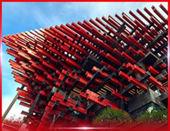
แลนด์มาร์คตึก ตึกตะเกียบ