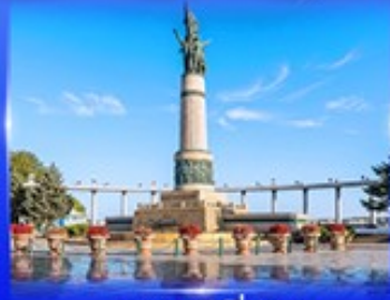
อนุสาวรีย์เทพีพร