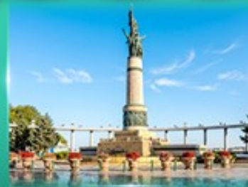
อนุสาวรีย์ไข่มุก