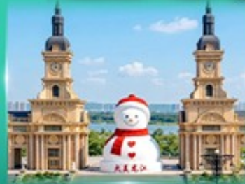
ตุ๊กตาหิมะยักษ์ ฮาร์บีน