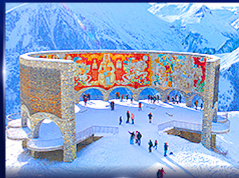
อนุสาวรีย์มิตรภาพ รัสเซีย-จอร์เจีย