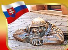
เช็คอินคูลูมิลเมืองบาตีสลวา