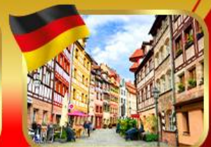
เที่ยวย่านเมืองเก่าบูร์กเบมเบิร์ก