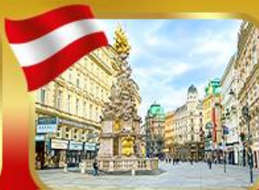
ช้อปปิ้งย่านคาร์ทเมอร์สตรีก