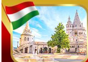
ป้อมชาวประมงเมืองบูดาเปสต์