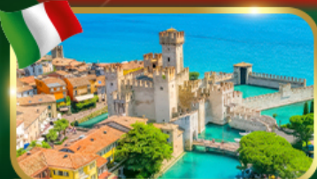
เมืองสวยริมทะเลสาบ เซอร์มियोเน่