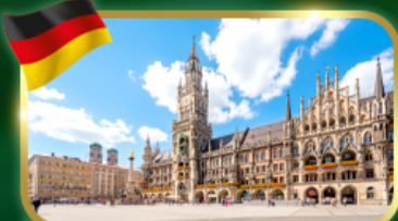
เช็คอิน จัตุรัสมาเรียนพลัทซ์