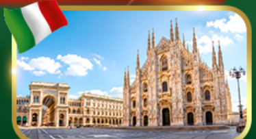
เช็คอิน มหาวิหารดูโอโมแห่งมิลาน