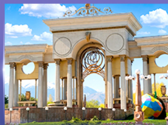
สวนสาธารณะประธานาธิบดี