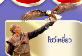
โชว์เหยี่ยว