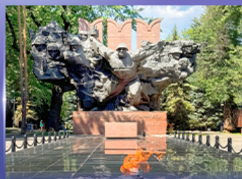
สวนสาธารณะ 28 Panfilov Park