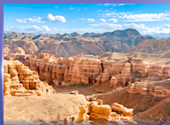
หุบเขาชาริน แคนยอน