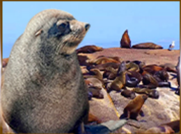
ส่องเรือชมฝูงแมวน้ำ Seal Island