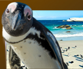
Simon's Town ชมฝูงเพนกวิน