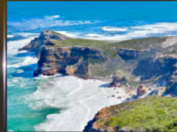
cape of good hope