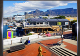
ท่าเรือ V&A waterfront