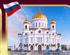
มหาวิหารเซนต์ซาเวียร์