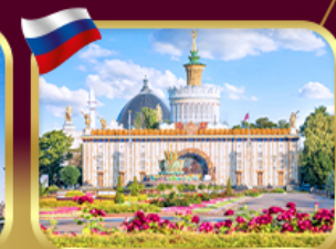
สวนสาธารณะ VDNKH