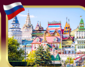
อิสมายลอฟสกีมาร์เก็ต