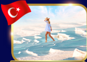
ปราสาทปูยฝ้าย ปามุคคาเล่