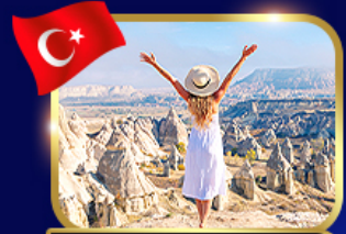
หุบเขาแห่งรัก ค้ปไฟโตเกีย