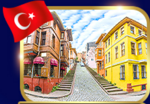
ชมบ้านหลากสี ย่านมาลัต