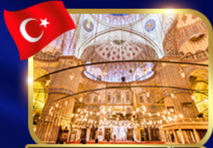
ชมความงามสุเหร่าสีน้ำเงิน