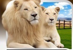
เข้าชมสวนเสือแบบใกล้ชิด The Lion Park