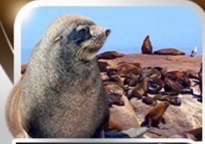
ล่องเรือชมฝูงแมวน้ำ ณ Seal Island

ตะลุยซาฟารี อุทยานสัตว์ป่าหุบเขาพิลาเนเบิร์ต