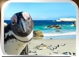
Simon's Town ชมนกเพนกวินสุดน่ารัก