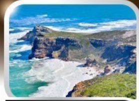
ชมวิวปลายสุดแอฟริกา cape of good hope