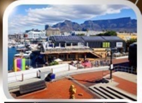
ช้อปปิ้งท่าเรือเบรนตันชั้นนำ V&A waterfront