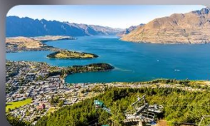
นั่ง Skyline สู่อโครสต์เซิร์ช