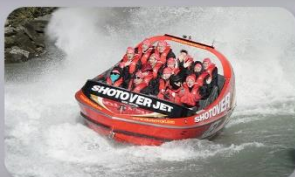
สนุกกับเรือ Shotover Jet