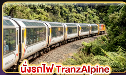
นั่งรถไฟTranzAlpine