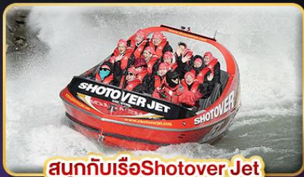
สนุกกับเรือ Shotover Jet