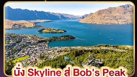
นั่ง Skyline สู่ Bob's Peak