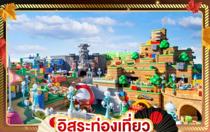
อิสระท่องเที่ยว