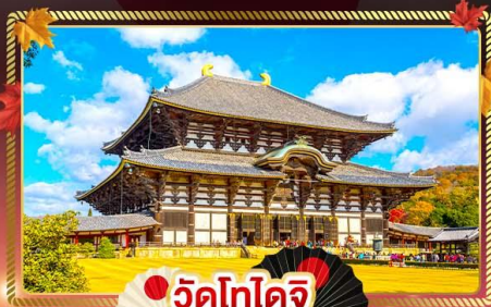
วัดโทโดจิ