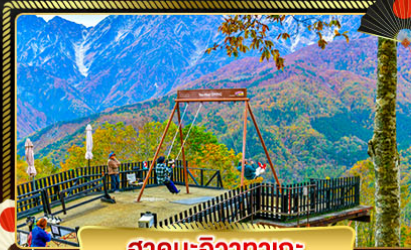
ฮาคุบะอิซากาตะ