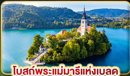
โบสถ์พระแม่มาเรียแห่งเบลด