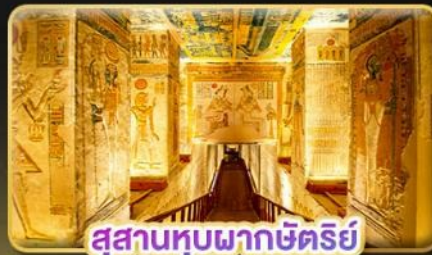
สุสานหุบผากษัตริย์