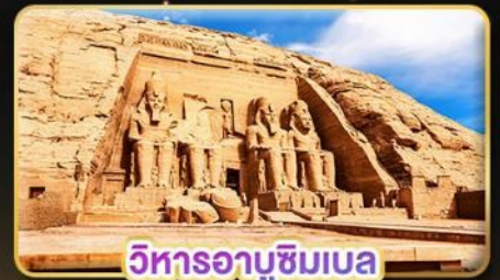
วิหารอาบูซิมเบล

น้ำหนักกระเป๋า 23Kg. (บินระหว่างประเทศ และบินภายใน)