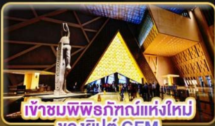
เข้าชมพิพิธภัณฑ์แห่งใหม่ ของอียิปต์ GEM