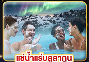
แช่น้ำแร่ลูลาగుน