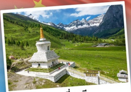
กู๋เจาสื่อครุณี

เที่ยว 2 อุทยาน กู๋เจาสื่อครุณี & ปี้เฉิงโกว เดินชมหมีแพนด้าสุดน่ารัก ใกล้ชิดกับแพนด้าแดง