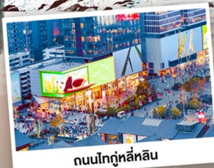
ถนนไท่กู๋หลี่หลิน